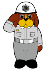
福岡市消防局マスコットキャラクター ファイ太くん

平成 28 年 12 月 17 日現在で、救急出動件数は 72,895 件 となり、平成 27 年中の救急出動件数 72,796 件 を既に上回り、平成 28 年の救急出動件数が過去最多となることになりました。