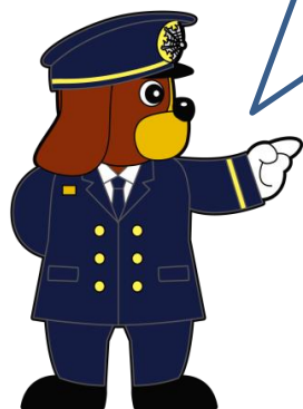
福岡市消防局マスコットキャラクター 「ファイ太くん」

※高圧ガス保安法が改正され、都道府県から政令市へ一部の事務・権限が移譲されることになりました。