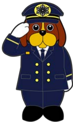
消防局マスコットキャラクター ファイ太くん